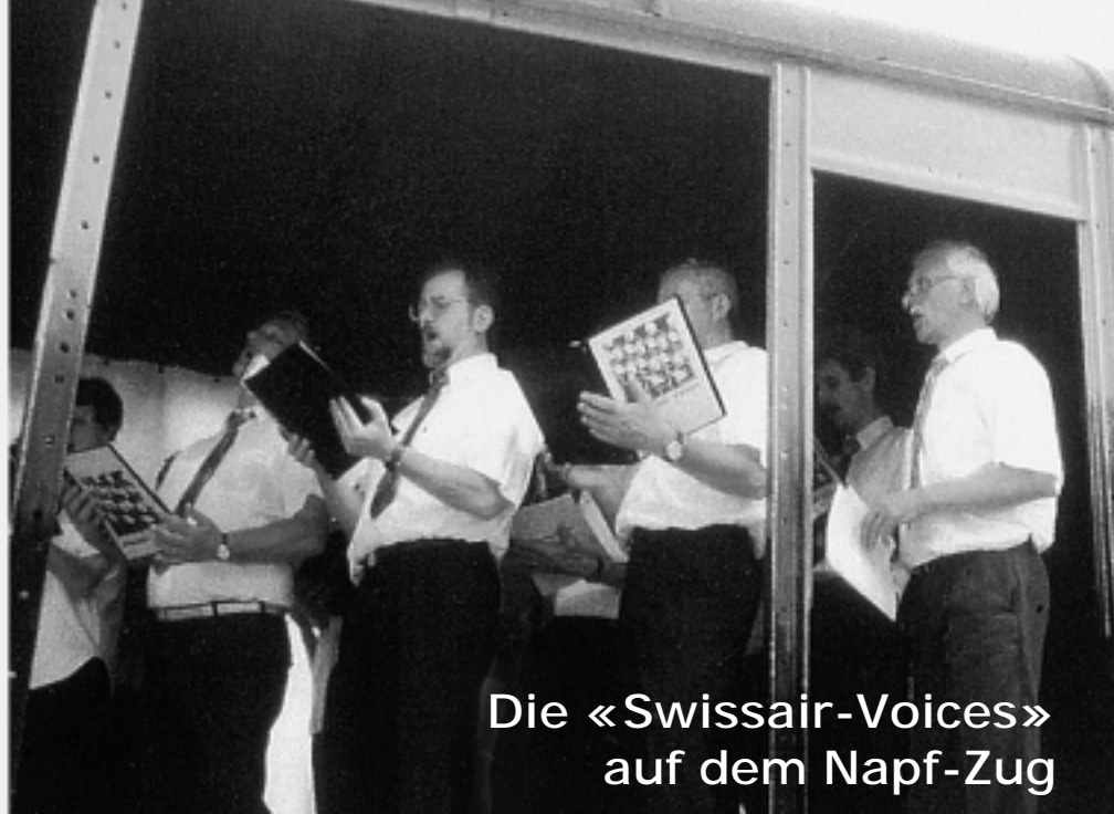
Die «Swissair-Voices» auf dem Napf-Zug